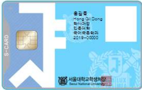
< 앞 면 >