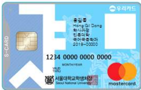
< 앞 면 >