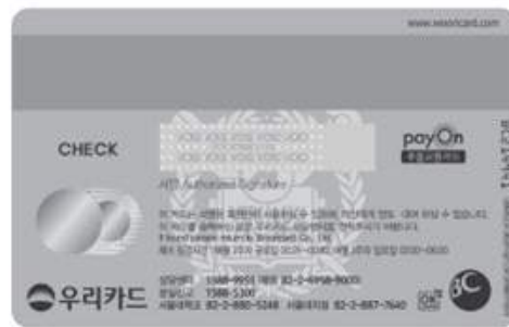
< 뒷 면 >